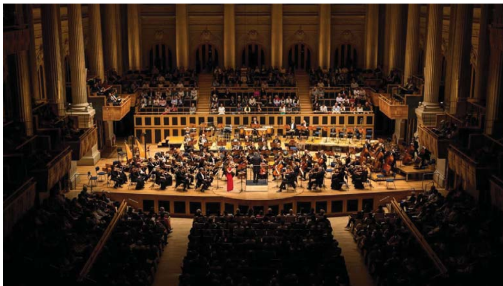
Concert du 2 octobre 2019 à la Sala de Sao Paulo, Brésil

Les concerts de la tournée ont reçu un accueil extrêmement chaleureux de plus de 16 000 mélomanes et ont été encensés par la critique comme en fait foi notre revue de presse. Le taux d'assistance moyen des concerts fut de 84 %, alors que la tournée a suscité 512 k vues sur Facebook.