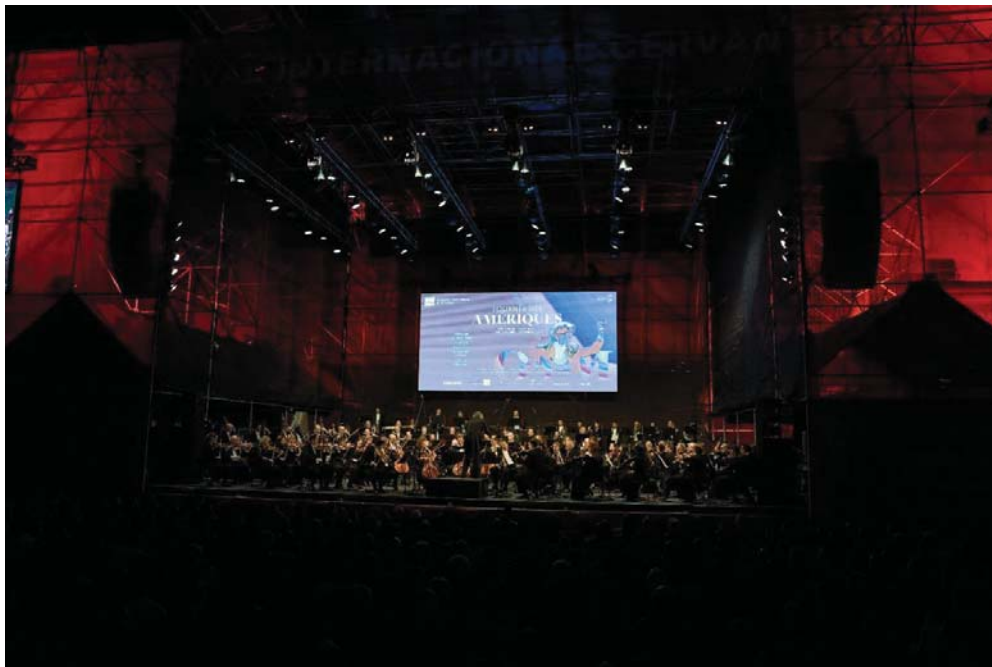
Concert le 15 octobre 2019 au Festival Cervantino, Guanajuato, Mexique