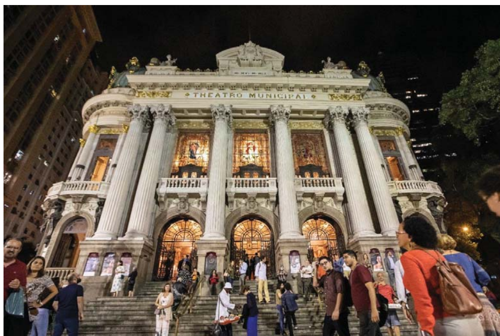
Concert du 3 octobre 2019 au Theatro Municipal de Rio de Janeiro, Brésil