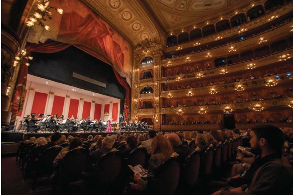
Concert le 7 octobre 2019 au Teatro Colon de Buenos Aires, Argentine